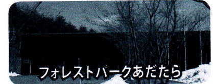
フォレストパークあだたら