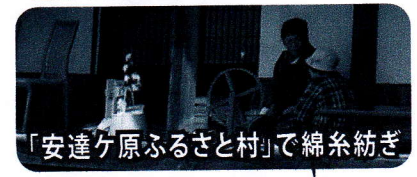
「安達ヶ原ふるさと村」で綿糸紡ぎ