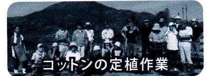
コットンの定植作業